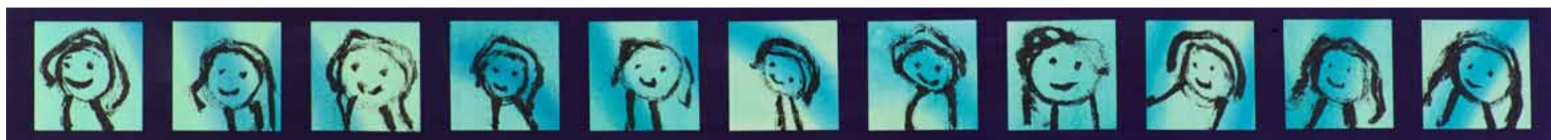
Gesichterreihe von N. B., gefertigt im «gestützten Malen»: Der Muskeltonus in Hand und Arm erfährt Halt und Sicherheit durch die Maltherapeutin.

Alle Zitate stammen aus dem Buch: «Der Mensch hat eine Unterschrift», Raffael-Verlag 2010, Ittigen, ISBN 978-3-9521326-6-1. www.der-mensch.ch