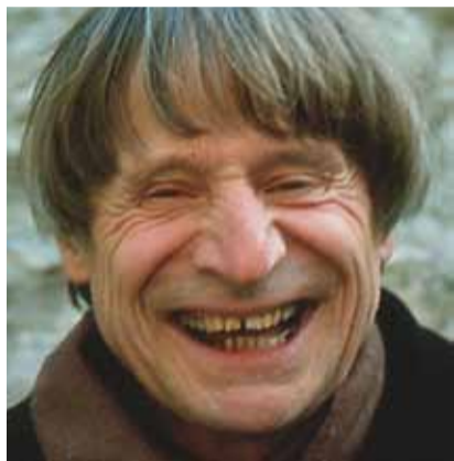
Dimitri gilt als einer der grössten Clowns, der das Publikum mit seiner Poesie und seinem grossen Herzen nicht nur zum Lachen bringt, sondern auch tief bewegt und berührt.

Kunst ist etwas Essenzielles. Sie fördert die Entwicklung, bereichert und erweitert den Geist. Sie wirkt ausgleichend, befreit und erfreut. So Dimitri in diesem Interview.