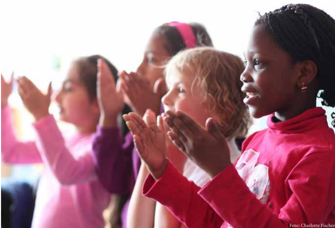
Das singende Kind in uns wiederentdecken und wecken.

Ist nicht die Welt, aus der die Träume des Kindes stammen, auch die Welt, aus der alle Visionen und Ideen für eine gesunde Weiterentwicklung des praktischen Lebens kommen? Brauchen wir nicht dringend die Fantasie und Spielfreude des Kindes, um den Alltag besser und schöner zu gestalten?