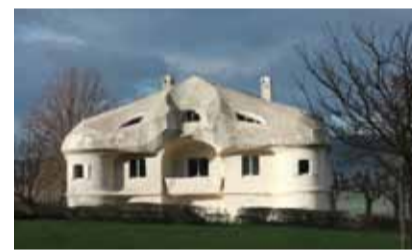
Jedes Haus eine Persönlichkeit.

Die Holzskulptur des Menschheitsrepräsentanten sollte im Mittelpunkt des ersten Goetheanums stehen, das jedoch in der Neujahrsnacht 1922/23 einer Brandstiftung zum Opfer fiel. Die Holzskulptur war zu diesem Zeitpunkt noch nicht fertig und deshalb am Bestimmungsort noch nicht aufgestellt. Sie entging dadurch dem zerstörenden Feuer.