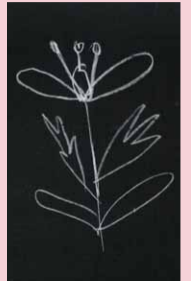
Wandtafelzeichnung von Rudolf Steiner zur Metamorphose der Pflanze, Vortrag vom 30. September 1922.

bau eine Reihe von Wohn- und Zweckbauten. Im Jahr 1919, in dem er mit seinem Buch «Die Kernpunkte der sozialen Frage» auf grosses Interesse gestossen war, hatte die Waldorfschule in Stuttgart unter seiner Leitung die Arbeit aufgenommen.