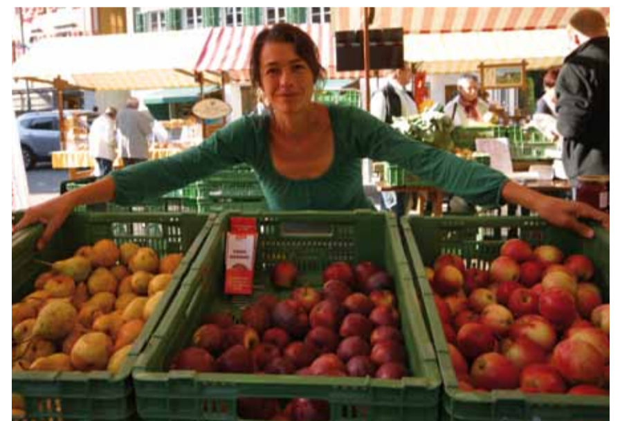
Achtsam und schöpferisch. Vom Hof bis zum Markt.

kommen. Dies planen wir, gemeinsam mit unserem Schwager zu tun. In der Stadt betreut er Flüchtlinge, die im Gemüseanbau arbeiten. Dies wollen wir nun mit ihm bei uns auf dem Land machen.